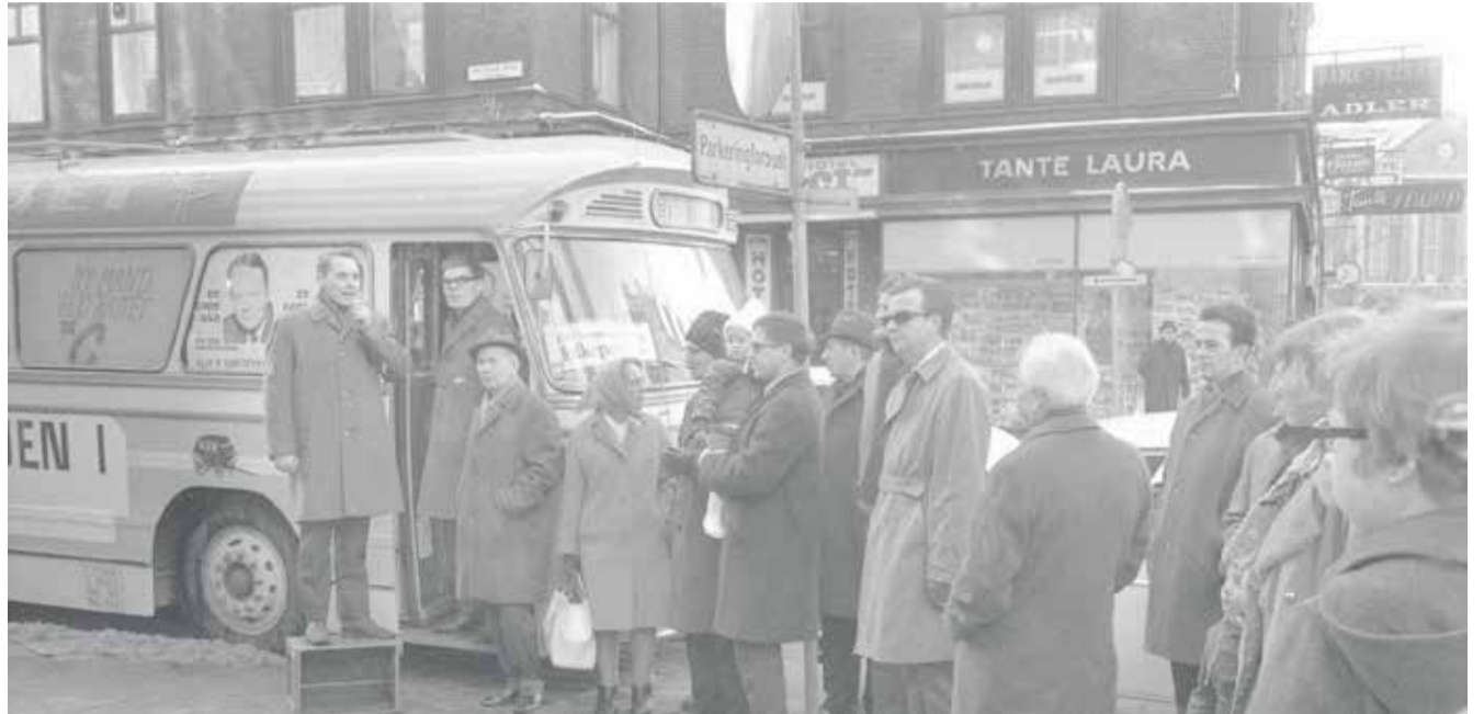
Den Konservative Vælgerforening har fostret mange politiske talenter. En af dem er Lars P. Gammelgaard, som her ses i busdøren ved et vælgermøde i Ryesgade. Gammelgaard, altid letgenkendelig med sine karakteristiske briller, fik en flot karriere i folkettinget, som blev kronet med posten som fiskeriminister i 1986.

Læg hertil, at borgmesteren frem til 1919 var kongeligt udpeget, og han stemte sammen med de konservative i de fleste sager.