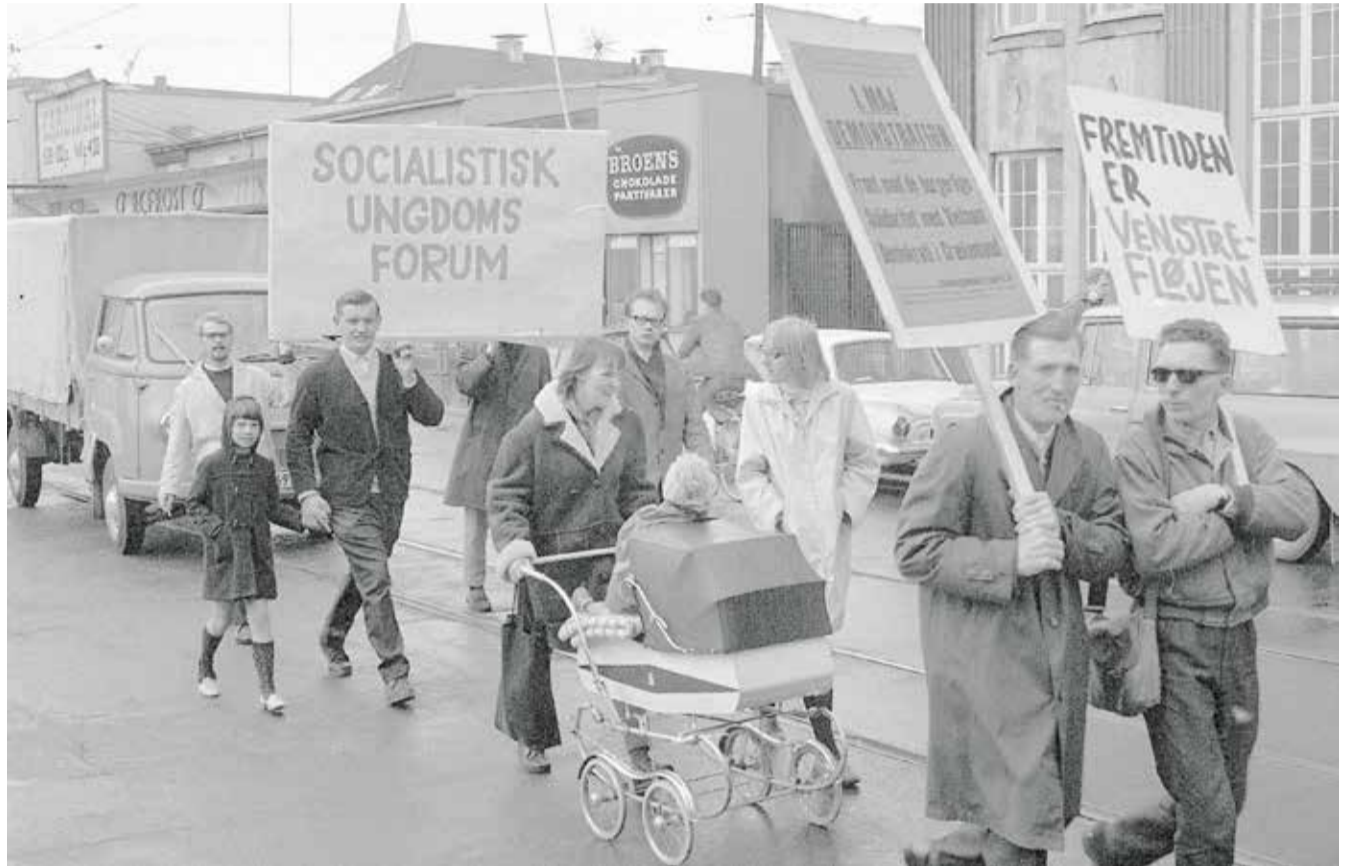
Socialistisk Ungdoms Forum, som her ses til 1. maj demonstration i M.P. Bruuns Gade, blev stiftet i 1961. Året efter blev gruppen officielt tilknyttet SF som partiets ungdomsorganisation. Ved partiets splittelse i 1967 fulgte SUF med Venstresocialisterne og rykkede længere ud på venstrefløj. I 1972 blev SUF til en del af den trotskistiske Revolutionære Socialisters Forbund.