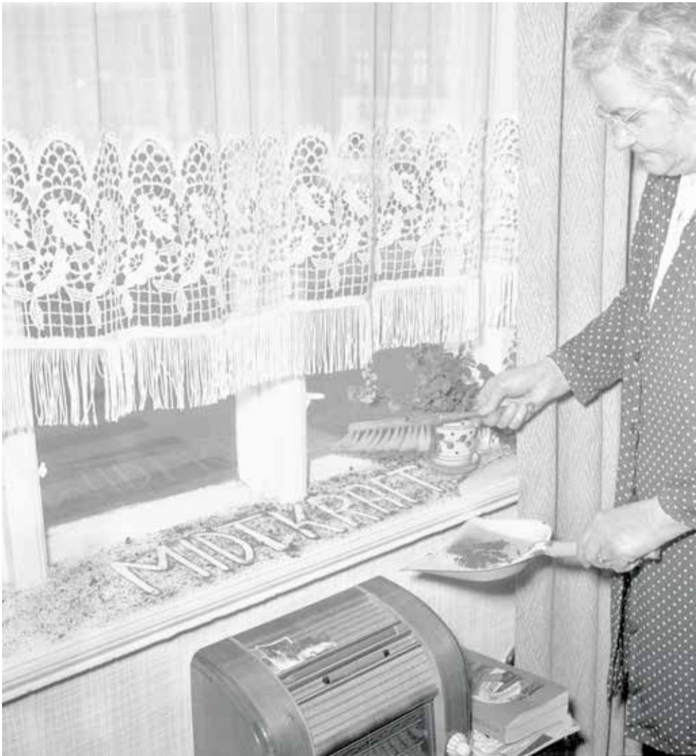
Midtkraft under anklage. Støv, røg og sod kunne være generende for midtbyens beboere, og så er det jo en fordel at have kost og fejeblad ved hånden. Fotograf Ib Rahbek-Clausen, april 1957. Original i Aarhus Stiftstidendes Billedsamling, Erhvervsarkivet, leveret af Aarhus Stadsarkiv.

I 1897 blev debatten om et elværk igen aktuel. Denne gang var anledningen en henvendelse fra oberstløjtnant Clausen, København,