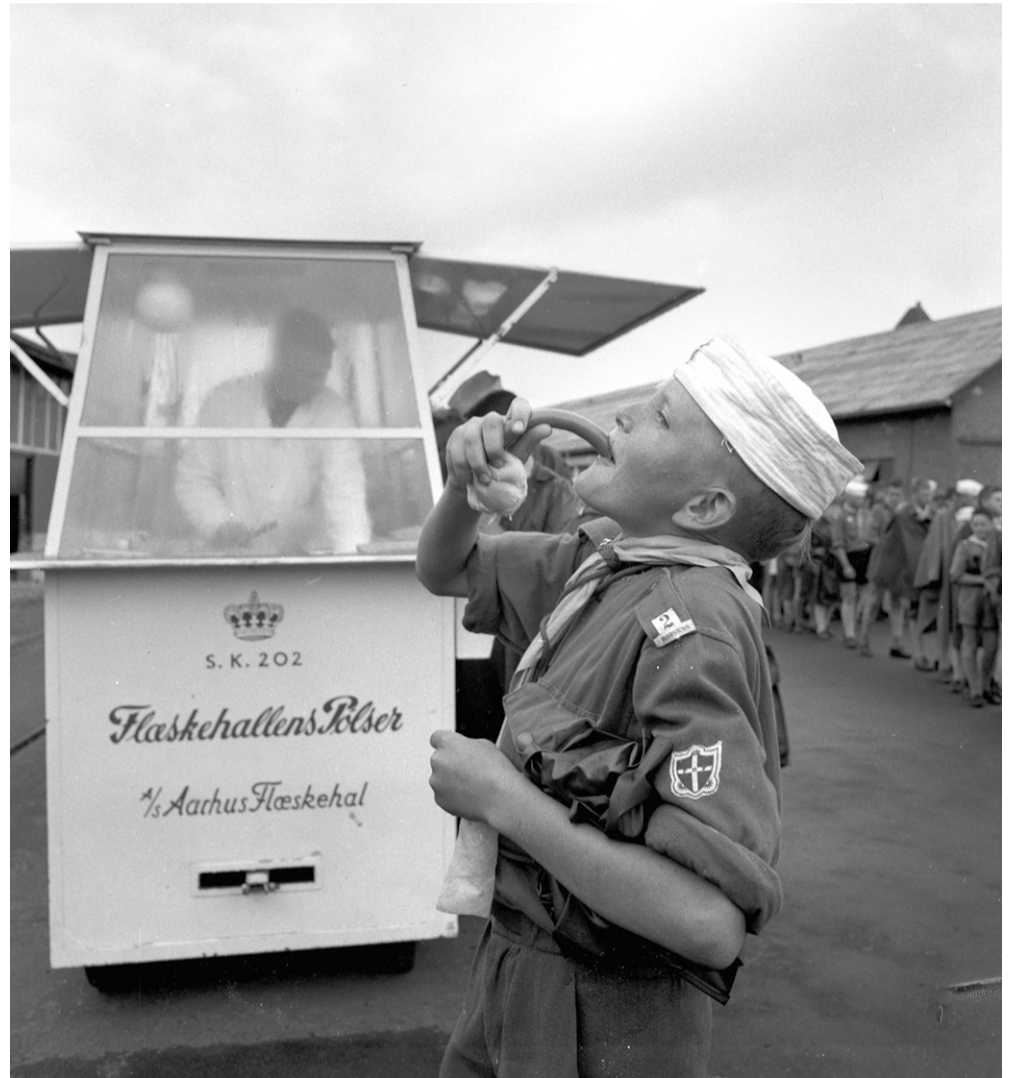
PDF'ere bliver bispist på »Aarhus-dagen« ved »Flæskehallen« i forbindelse med FDF'ernes store landslejr i juli 1962. Ukendt fotograf, 12. juli 1962. Original i Aarhus Stiftstidendes Billedsamling, Erhvervsarkivet, leveret af Aarhus Stadsarkiv.

I 1930'erne begyndte slagtehuset at udleje lokaler til