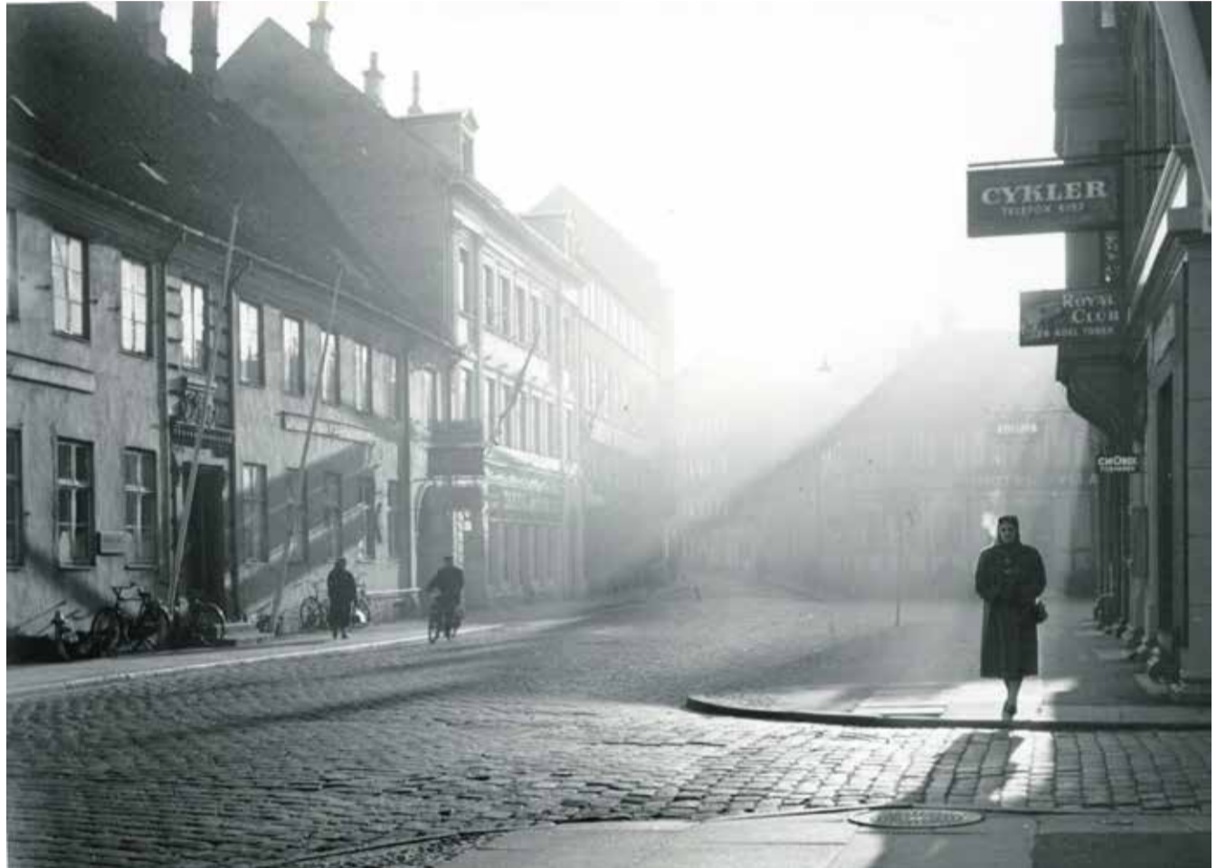
Nørreport, fotograferet 14. november 1955 om morgenen. Alle ejendomme i billedets højre side er væk, også Hotel Jylland i baggrunden.

Og nu tog han altså ordet igen på mødet i januar