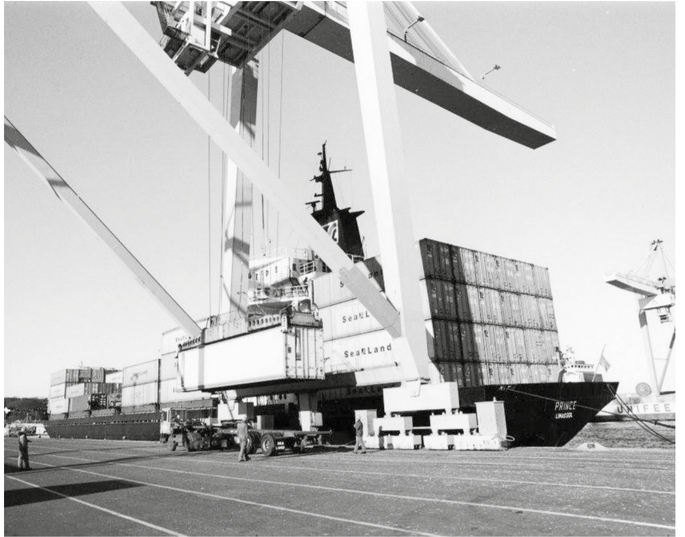
Containerskib losses i Århus havn i 1993. Firmanavnet Sea-Land, som kan skimtes på containerne bag kranen, var grundlagt af McLean - faderen til den moderne fragtfart. Han blev en af USA's rigeste, men forfejlede spekulationer i olie spiste formuen væk. Mærsk-koncernen overtog de internationale dele af Sea-Land Service Inc. i 1999. To år efter døde McLean 87 år gammel.

I 1970 åbnede således Århus containerterminal, og på nordsiden af pier 3 opstillede man en 50 tons kran med henblik på at servicere containertrafikken, der var i så stor stigning, at man allerede i 1972 måtte rejse havnens første dedikerede containerkran