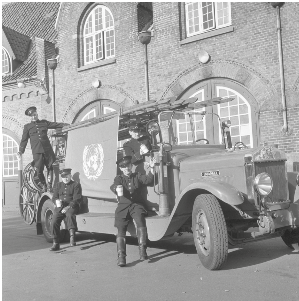
I 1963 fik Ny Munkegades brandmænd gjort den gamle Triangel-brandbil køreklar, så den kunne blive kørt rundt i Aarhus' gader. Anledningen var FN-dagen, hvor brandmændene solgte FN-mærker rundt om i byen.

Oprindeligt var området ved det nuværende Ny Munkegade et isoleret kvarter, som ikke blev videreført af en landevej, men kun blev benyttet af byens egne borgere, når de skulle ud til deres jordlodder nordvest for byen. Isolationen gjorde, at stedet var godt egnet til byens krudttårn; langt væk fra byen og dens mange brandfarer. Udover krudttårnet lå der i begyndelsen af 1800-tallet en række fattighaver i området omkring den nordlige del af gaden, mens Steinbrenners store teglværk var at finde i gadens nederste