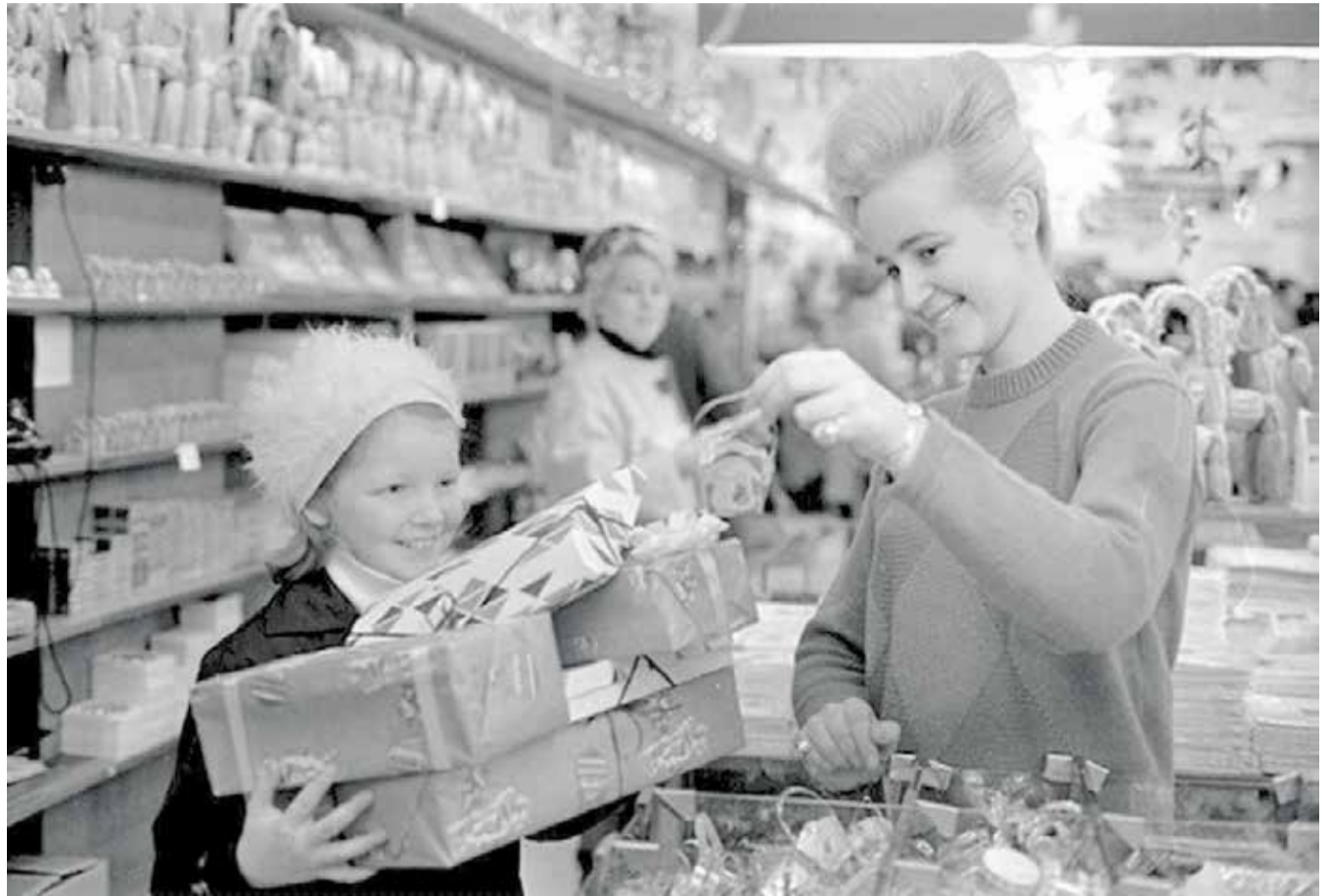
Under 1960'ernes højkonjunktur var der godt gang i julehandelen. Dette billede fra julehandelen i Salling blev bragt i Århus Stiftstidende i 1963 under overskriften »Større julehandel end tidligere aar«. Foto: Ib Rahbek-Clausen, 8. december 1963. Original i Aarhus Stiftstidendes Billedsamling, Erhvervsarkivet, leveret af Aarhus Stadsarkiv.

Efterhånden som udbredelsen og antallet af gaver til børnene voksede, begyndte