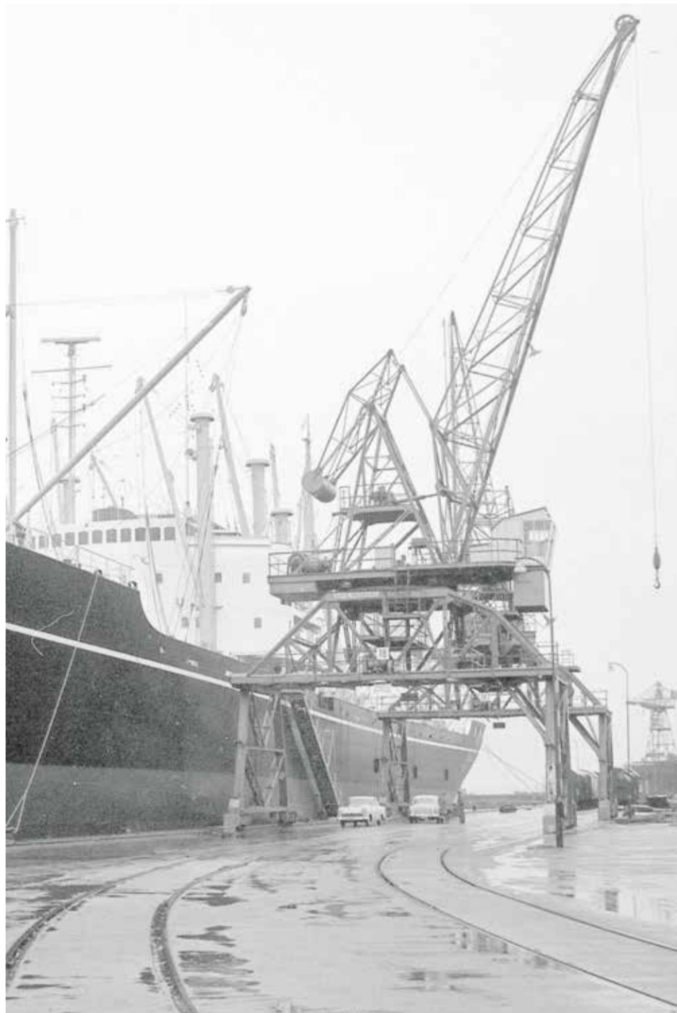
Kran 18 ved pier 1 i 1961.

Mekaniseringen fortsatte i 1920'erne og gav et effektivt løft i kullosningen. I stedet for at bære kullene i tønder og sække blev en stor spand med plads til ca. et ton kul sænket ned i la-