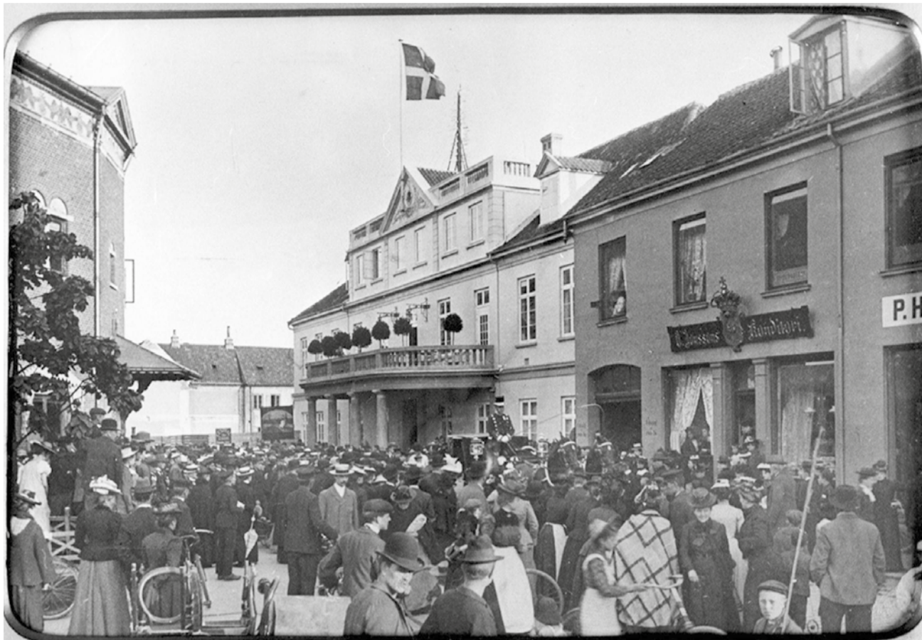
Prins Christian (senere kong Christian X) og prinsesse Alexandrine ankommer til festmiddag i Polyhymnia, Kannikegade 14.

Bygningen gav også plads til et teater i nr. 16, så borgerskabet stadig kunne optræde på de skrå brædder. I 1822 var det imidlertid slut med borgernes egne forestillinger, og de omrejsende teatertrupper tog endegyldigt over.