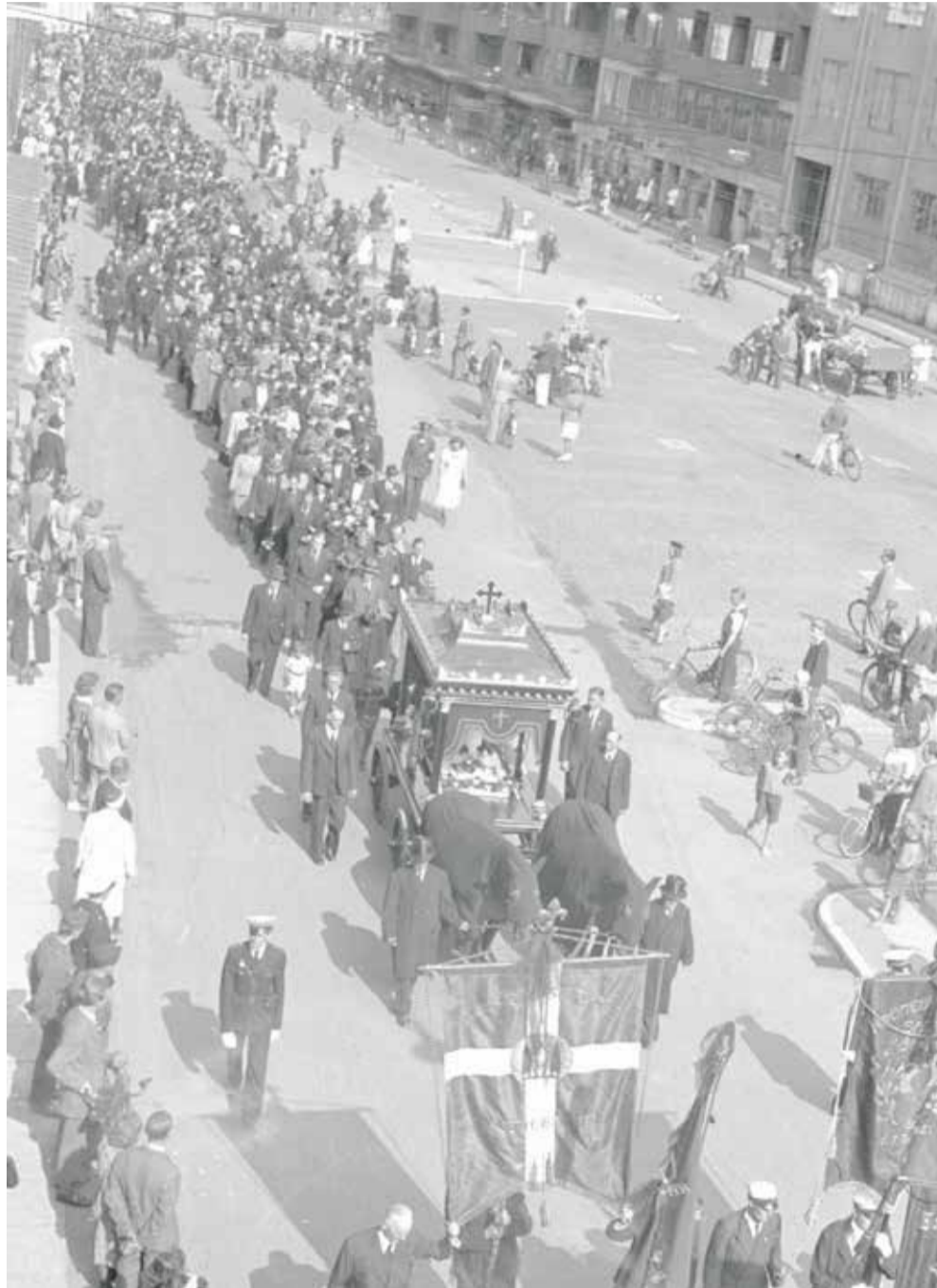
Et kilometerlangt sørgetog, med urnen for de 12 uidentificerede dræbte, på vej til Vestre Kirkegaard.

Flere end 2000 granater, projektiler og sprængstykker regnede ned over store dele af byen. Overalt i byen lød der mindre eksplosioner, som også krævede deres ofre. Gavle blev trykket ind, skorstenene væltede, mens tagstenen løftede sig af hustagene og blandede sig med knust glas og projektiler.