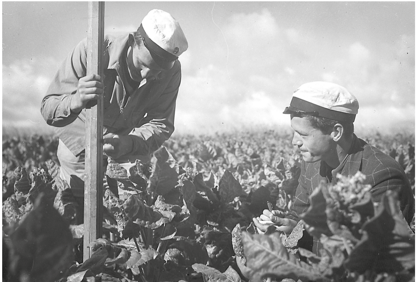
To københavnske studenter i gang med at opmåle tobaksplanterne og dyrkningsarealerne på Fredensgaard i Viby. Fotograf: Ukendt, 14. august 1944. Original i Aarhus Stiftstidendes Billedsamling, Erhvervsarkivet, leveret af Aarhus Stadsarkiv.

Når familien eller nabokonen skulle inviteres på kaffe, bryggede husmoderen den sikkert på en af de to konkurrerende erstatningsmærker Richs eller Danmark. Så længe lagrene var fyldte, kunne man med ratione-