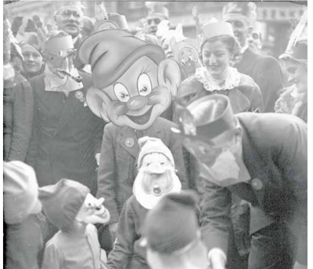
I 1938 havde »Snehvide« premiere i Regina-Teatret, og folk fra hele Jylland valfartede til Aarhus for at se Walt Disneys tegnefilm. Også en ålborgensisk Dumpe havde sammen med mange andre udklædte ålborgensere fundet vej til Regina-Teatret.