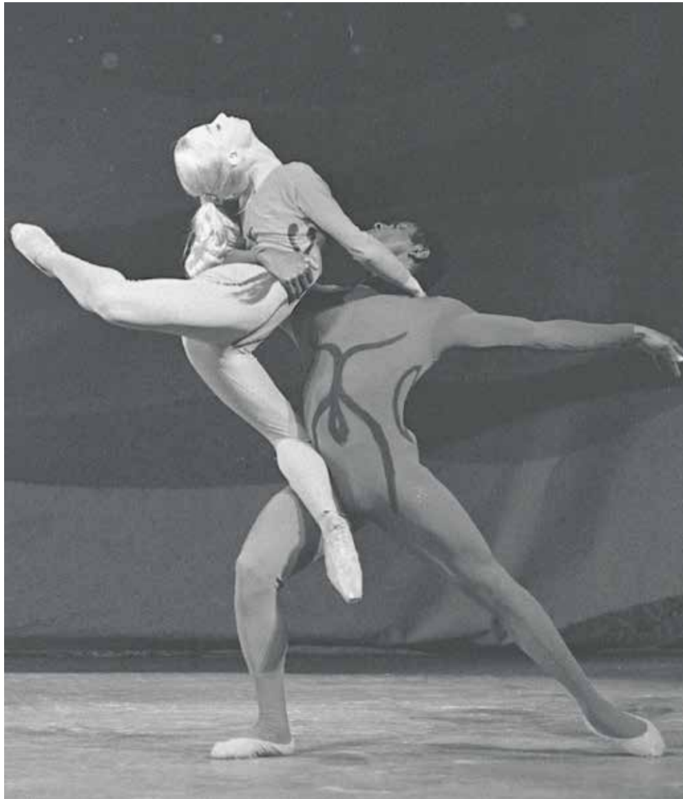
Dans i alle afskygninger har lige siden den første festuge i 1965 været store attraktioner i Aarhus Festuge, lige fra afrikansk trommedans til klassisk ballet. Den Skandinaviske Ballet gæstede Aarhus Teater i Festugen 1965 og vakte stor glæde.

Der var i princippet tale om et eksperiment, da det var usikkert, om projektet kunne holde. Det skulle dog vise sig at være en succes; aarhusianerne mødte talstærkt og interesserede