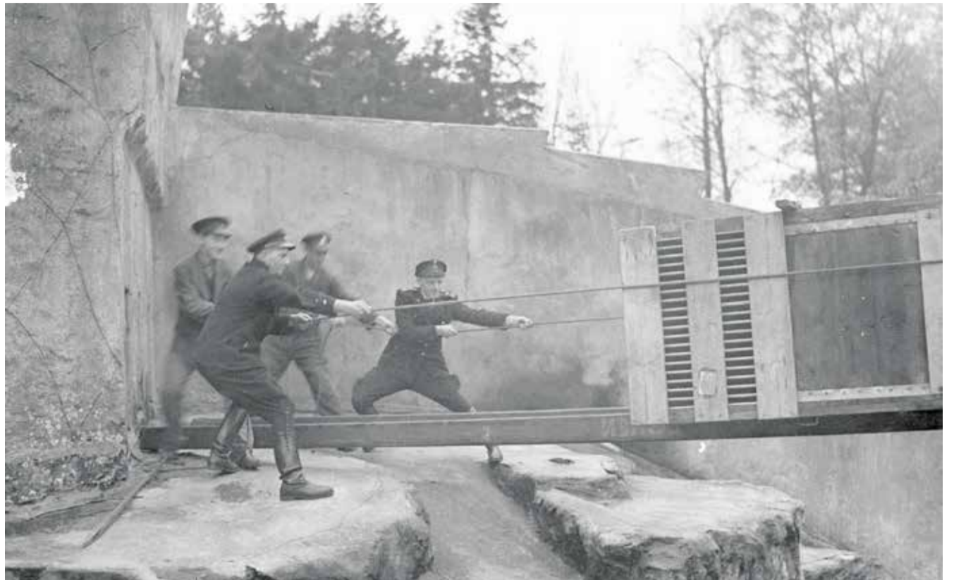
Sådan kan man også blive slæbt af sted på rejse. Den store hanisbjørn var på vej til Stockholm Zoo, hvortil han var blevet solgt, da man der havde mange hunisbjørne men manglende en han. Slæbearbejdet blev i øvrigt betegnet som yderst farligt.