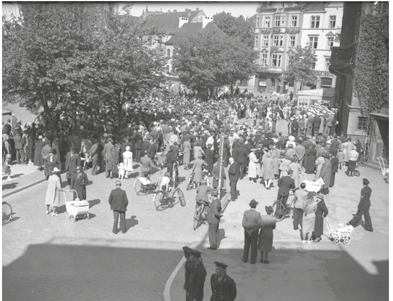
Kernevælgere i kendte omgivelser. Møde blandt radikale kernevælgere i husmandsföreningen i Østergades Hotel - den tidligere Folkelige Forsamlingsbygning - i samme lokaler, som Det Radikale Venstre benyttede.