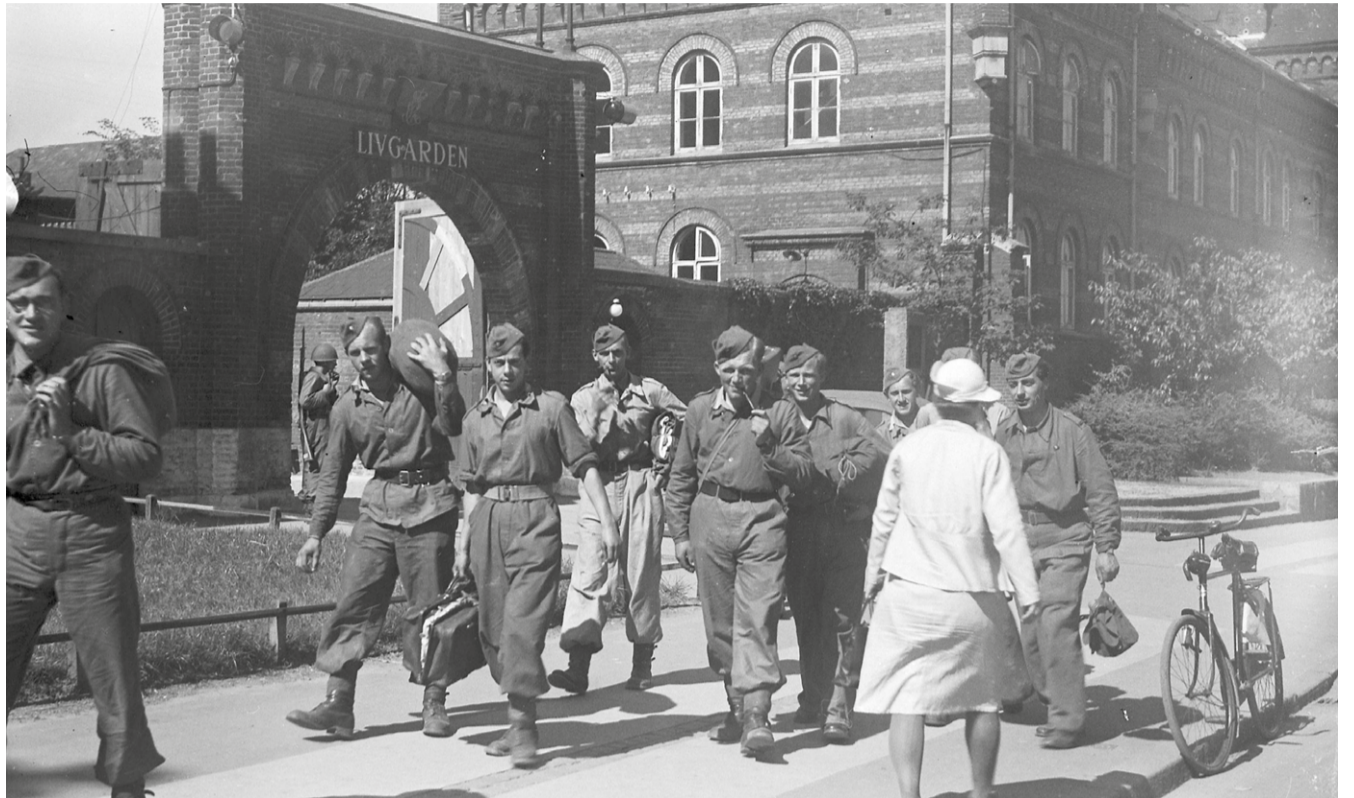
På toppen af Vester Allé opførtes 1876-1877 ridehus og rytterkasernerne. Efter besættelsen rykkede der igen danske soldater ind på kasernerne. I første omgang var det indkaldte livgardere fra Jylland og Fyn, der blev indkvarteret på kasernen.