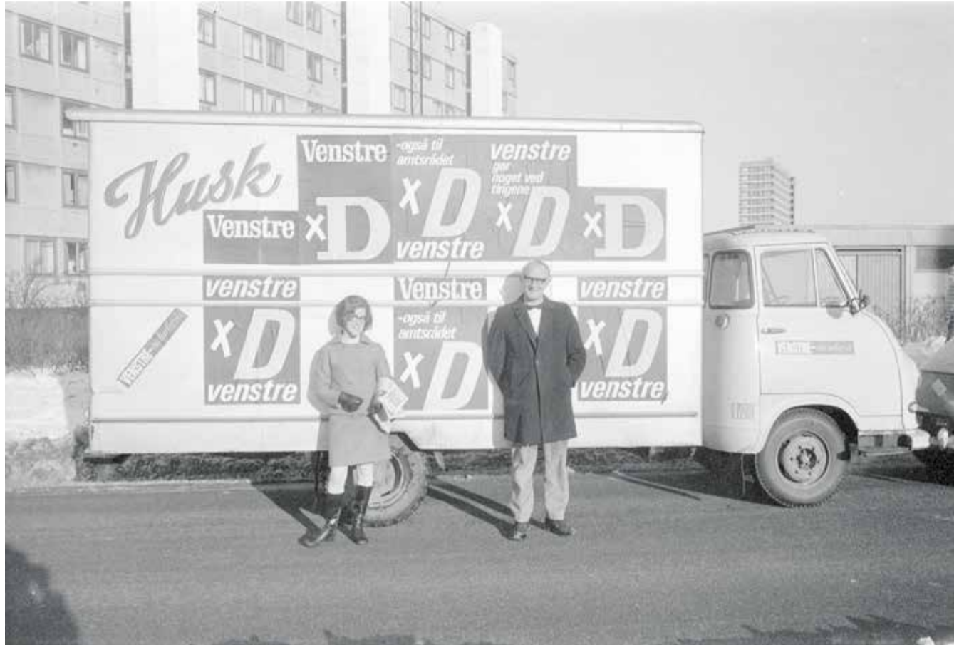
Ved valget i 1970 blev Venstre endeligt 'husket' af vælgerne. Her er valgbussen ved Langenæs Allé under valgkampen, der blev den første efter kommunesammenlægningen.