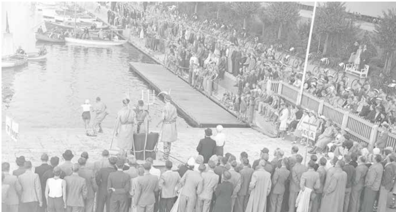
Tilløbsstykket er stort, når Havkongen Neptun er i byen til den årlige ceremoni - kanindåben. Som handels- og orlogslådens berømte ækvatordåb må nye roere underkaste sig den højtidelige dåb, hvor de bliver indsmurt i til lejligheden fremstillet »vievand«. Fotograf: Ukendt, 14. august 1940, original i Århus Stiftstidendes Billedsamling, Erhvervsarkivet, leveret af Aarhus Stadsarkiv.

Den hårde træning fortsatte dog ufortrødent, men den 19. september ramte uheldet. På en langtur til Mols blev ro- erne på grund af en pludse- lig storm tvunget i land. Da mændene var kommet sik-