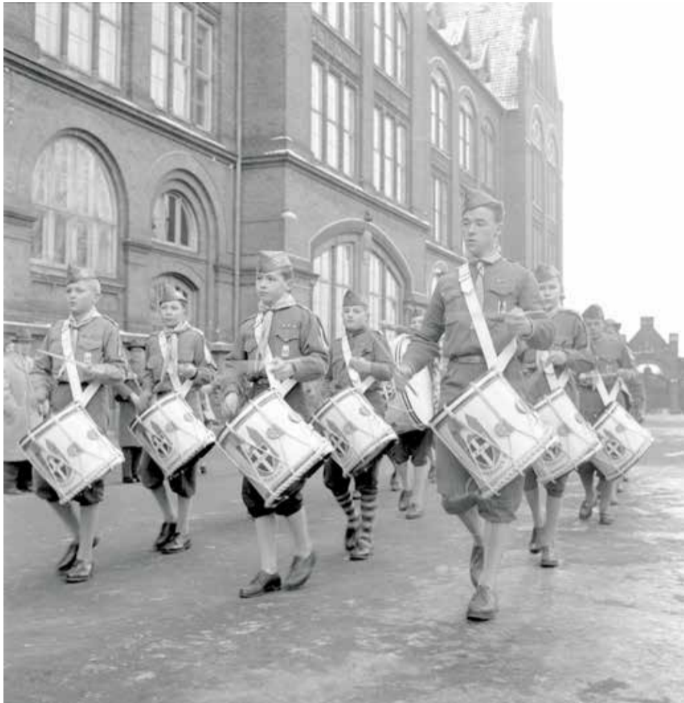
På kyndelmisse i 1958 indviede FDF Aarhus sit nye trommekorps i skolegården på N.J. Fjordsgades Skole. 2. februar 1958.

Indtil 1960 holdt elevtallet på Fjordsgade Skole sig omkring 950 elever, men i løbet af 1960'erne faldt elevtallet drastisk til omkring de 500 elever. Det faldende elevtal i 1960'erne var generelt for Aarhus, hvilket havde flere grunde. For det første var Aarhus var ved at være fuldt udbygget. For det andet var 1940'ernes store årgange nået igennem skolesystemet, og