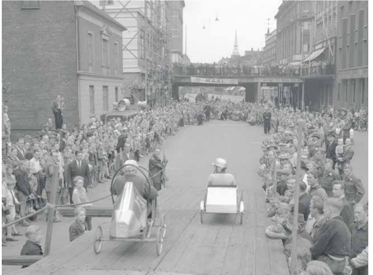
I et halvt århundrede levede den sidste del af Aarhus Å en rørlagt underjordisk tilværelse. Åens tildækning gav plads til den store Åboulevard, som her bliver benyttet til sæbekasseløb i 1952.

I en periode på 30 år fik de fleste århusianere leveret åvand til vandha-