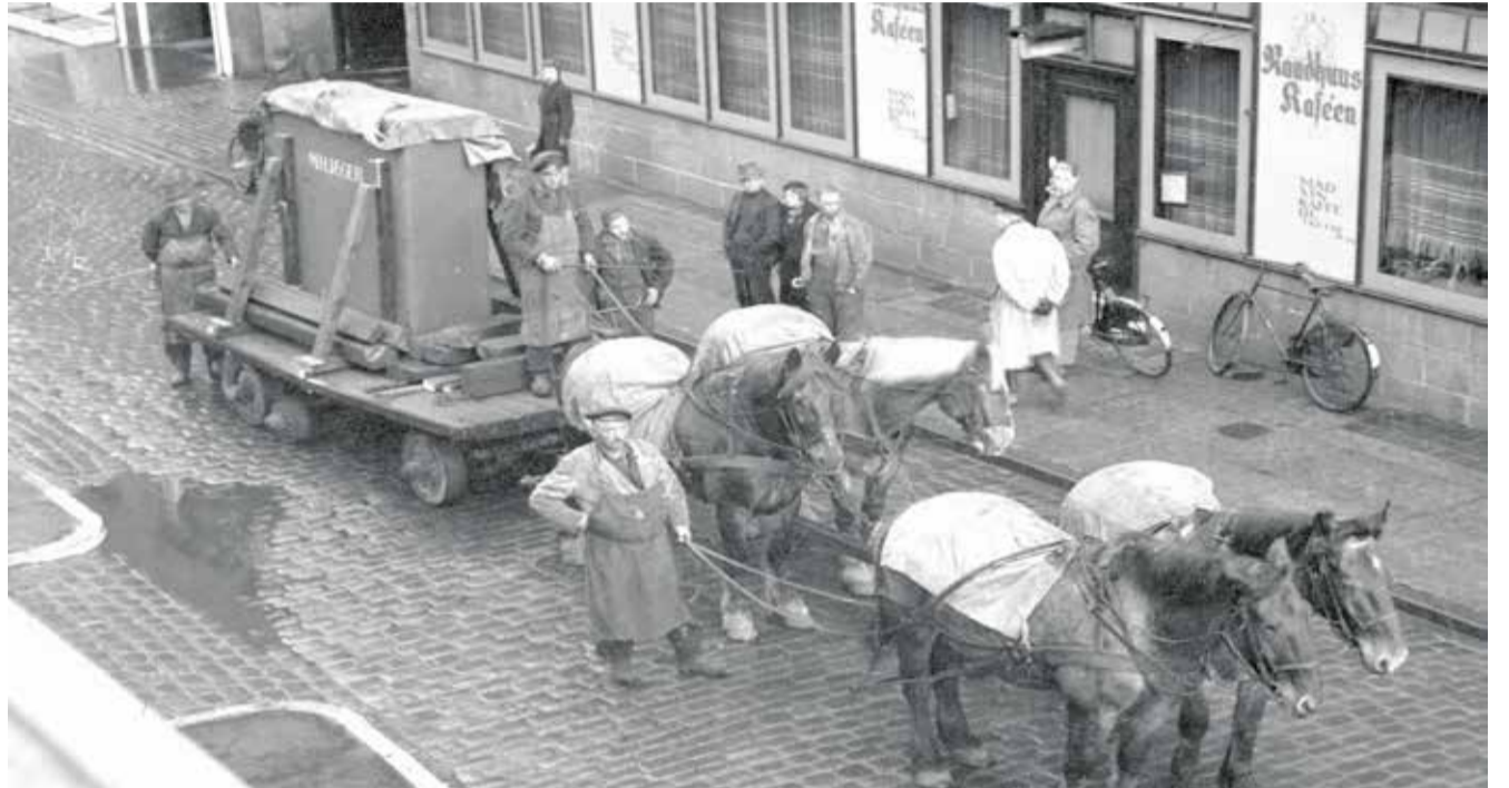
Fire store, stærke trækheste og en særdeles solid vogn skulle der til at fragte den tonstunge boksdør fra M. H. Jægers Pengeskabsfabrik i Mejlgade til Handelsbankens nye afdeling på Rådhuspladsen.

Produktionen voksede hastigt, og M. H. Jægers Pengeskabsfabrik udviklede sig efterhånden til at blive den førende pengeskabsproducent