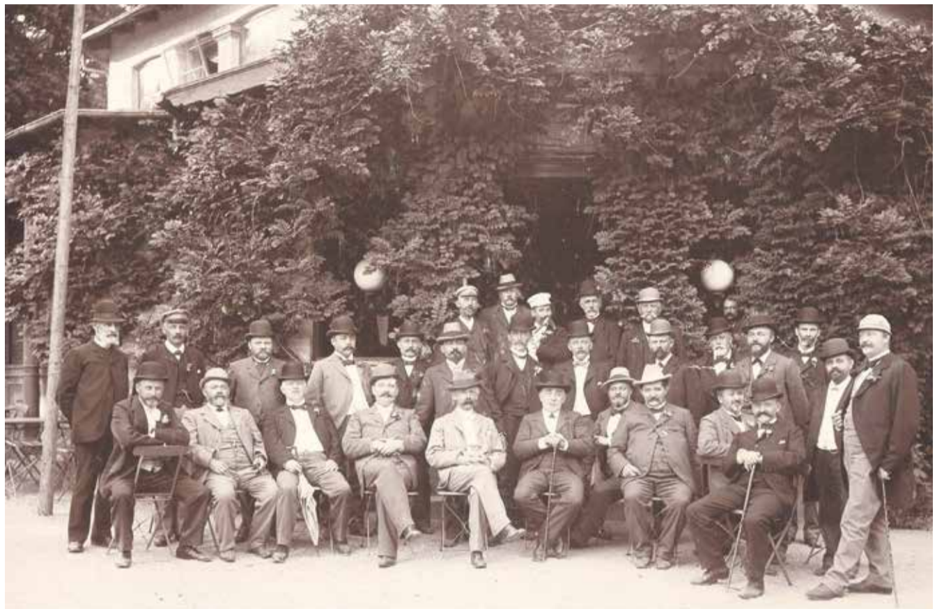
I denne tid snakkes der meget om politikernes dyre udlandsrejser. Mindre kan også gøre det. Her ses Aarhus Byråd med embedsmænd på deres årlige udflugt til Pavillonen i Riis Skov, 1896.