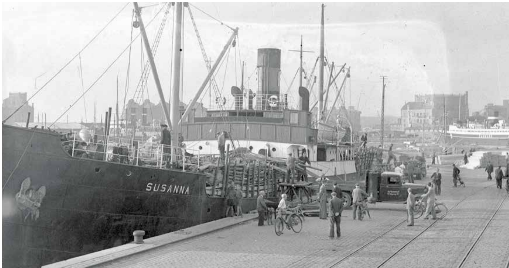
Der losses en dækslast af træ fra 'Susanna' ca. 1943.