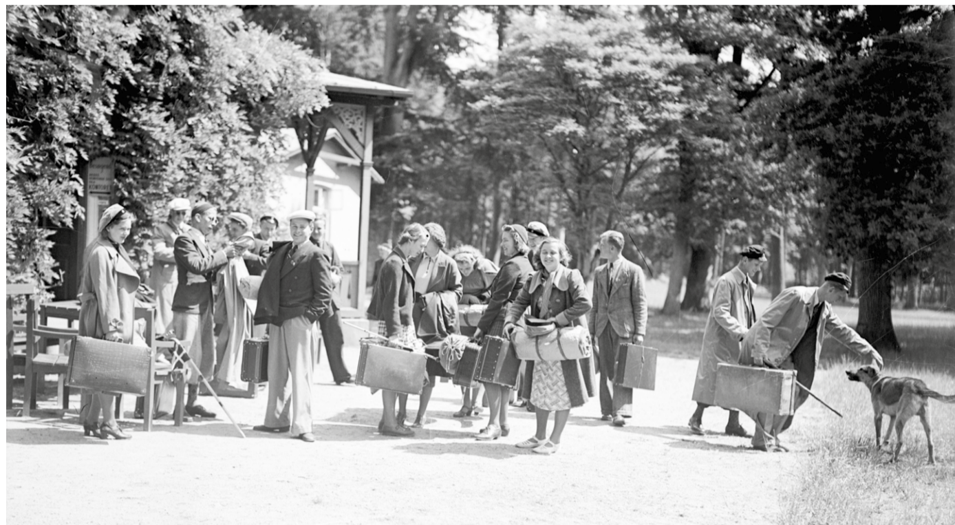
I 1938 blev Pavillonen omdannet til vandrerhjem. På billedet gør en gruppe unge vandrerere holdt ved den smukke bygning en sommerdag i 1939. Fotograf ukendt, 18. juni 1939, original i Århus Stiftstidendes Billedsamling, Erhvervsarkivet, leveret af Aarhus Stadsarkiv.