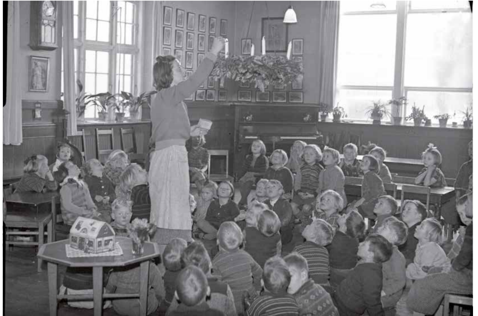
I dag er det 1. søndag advent - en tradition, der også er blevet fejret i Guldbryllupsasylet. De første adventskranser sneget sig op fra Tyskland omkring 1. verdenskrig, men det var først under 2. verdenskrig, at kransen med de fire lys for alvor blev en fast bestanddel i de danske julehjem. 3. december 1942.

Aarhus Stiftstidende var også til stede ved indvielsen, og den efterfølgende dag kunne aarhusianerne læse i avisen: »Asylet synes helt igennem fortrinligt indrettet. Det er et i Sandhed smukt og skønt Mindesmærke, der her er sat