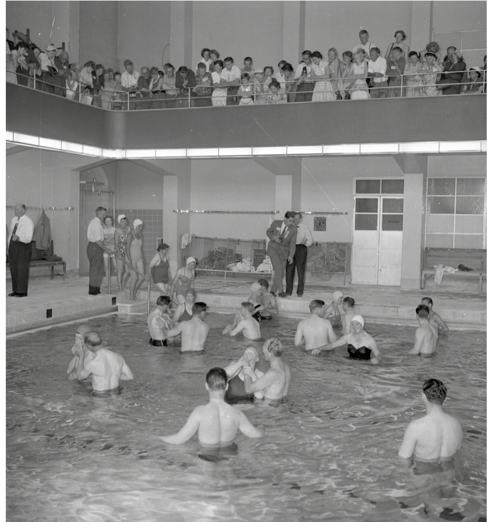
21. juli 1956 var det ikke konkurrencesvømmere, der fyldte svømmehallen, men Jehovas Vidner. 462 medlemmer i alderen 11-83 år blev på én dag døbt af 12 døbere.

Al den moderne teknologi var ikke gratis, og det oprindelige budget på 750.000 kr. blev overskredet med 50 procent. Den socialdemokratiske borgmester H.P. Christensen forsvarede det overskredne budget, og badeanstalten gik spottende under betegnelsen »Smedens Vaskehus« med henvisning til