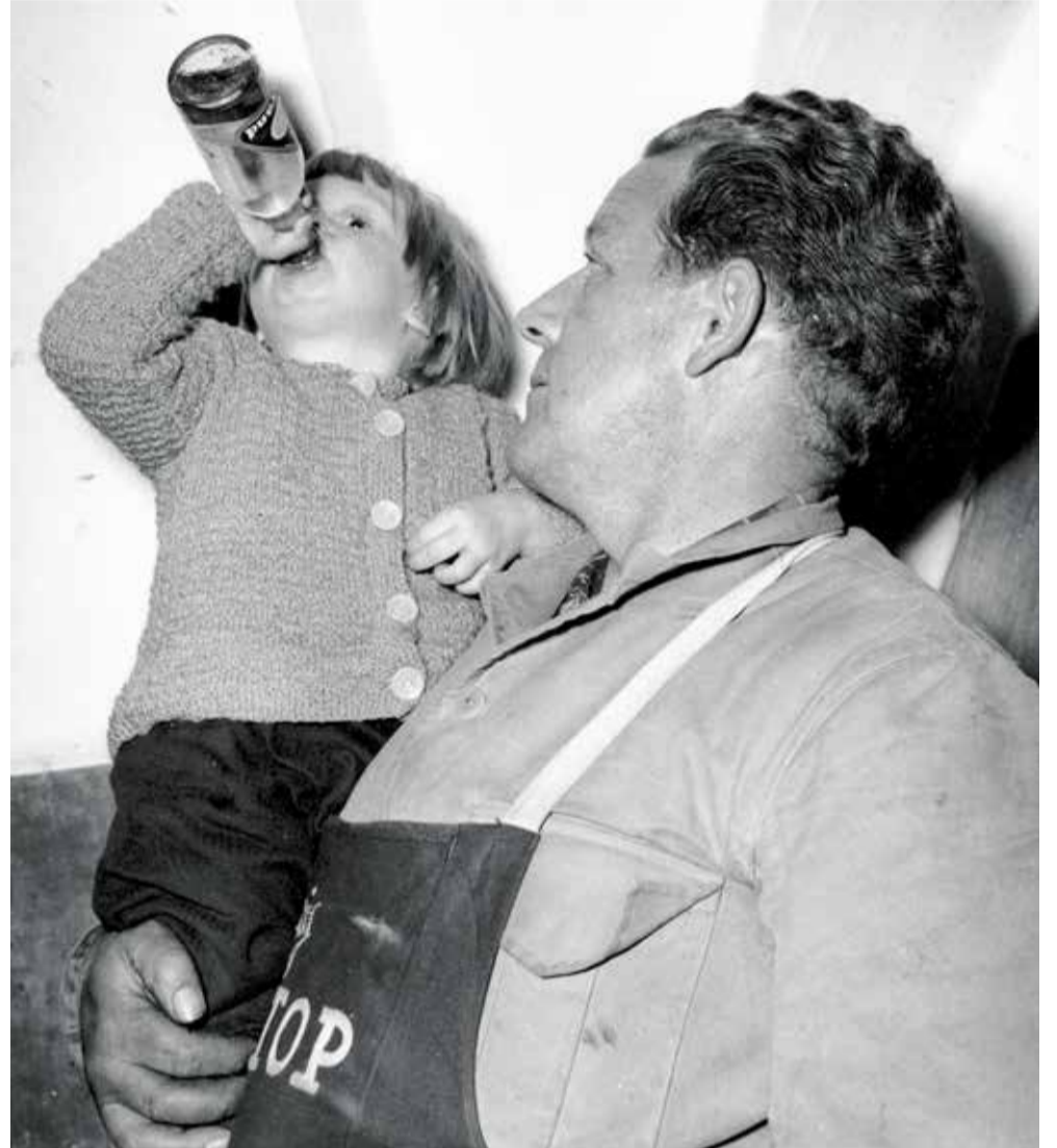
Et besøg på Ceres har alle dage været populært. Fotograf Børge Venge, 1954. Original i Erhvervsarkivets Billedsamling, leveret af Aarhus Stadsarkiv.

28. november 2008 forlod den sidste bryg tappehal-