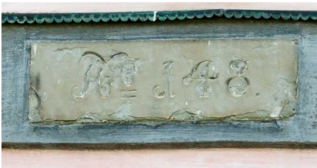
Figur 1 Hus nr. 148: Studsgade 70, Nørreport 20, 01-06-2015