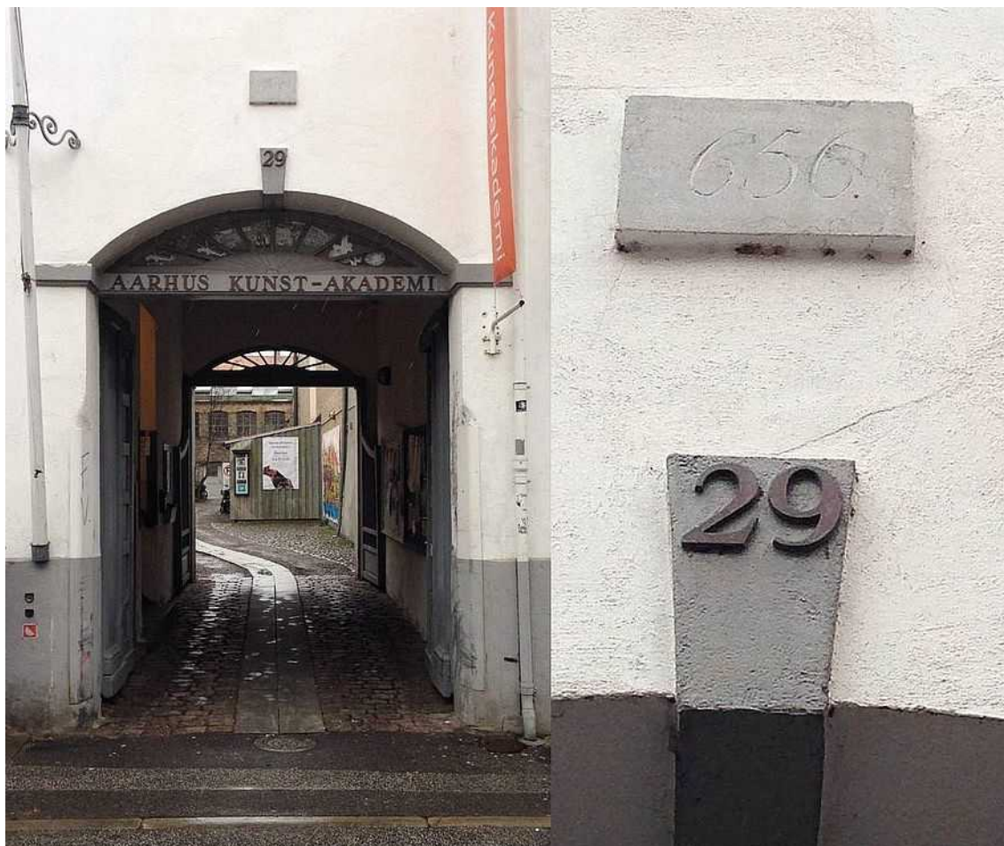
Figur 2 Husnumre på Vestergade 29/656, Aarhus Kunst-Akademi, 2015 Torben Aastrup

På nogle bygninger valgte man en mere langsigtet løsning med indgravering af husnummeret, som det ses på denne ejendom med det gamle hus 656 og det nye husnummer 29: