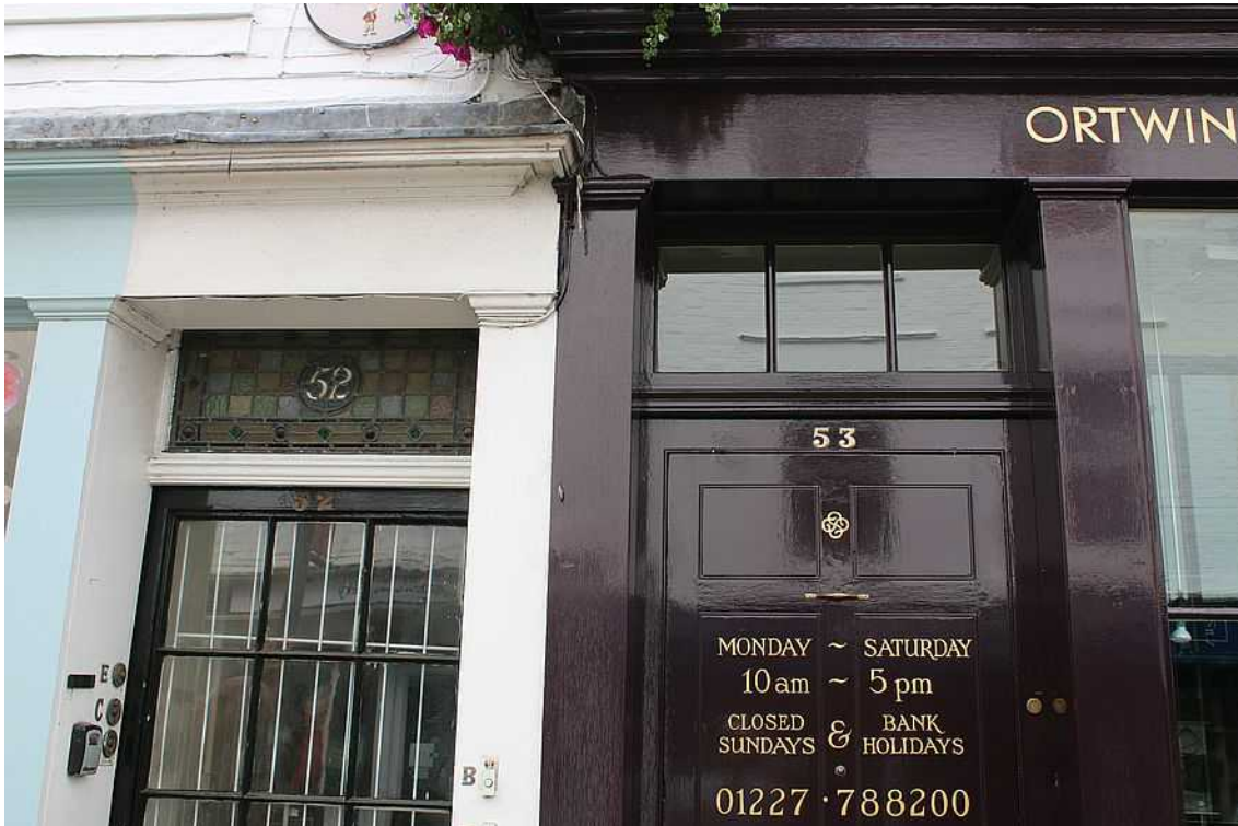
Figur 3 Fortløbende husnumre i Canterbury, 2016